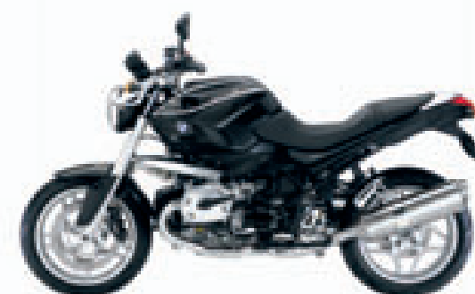
nachtschwarz uni met striping